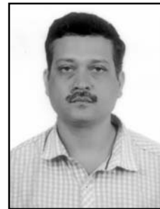
ನಂದನ್ ಪತ್ರಾವೊ ಸಾಂ. ಜುಜಿ ವಾಡೊ

ನವ್ಯಾನ್ ಗುರ್ಕಾರ್ ಜಾವ್ನ್ ವಿಂಚುನ್ ಆಯ್ಲಲ್ಯಾ ತುಮ್ಮಾಂ ಉಲ್ಲಾಸಿತಾಂವ್ ಆನಿ ತುಮ್ಮಾಂ ವಾವ್ರಾಕ್ ಬರೆಂ ಮಾಗ್ತಾಂವ್ ವಿಗಾರ್, ಸಹಾಯಕ್ ವಿಗಾರ್ ಆನಿ ದೇವ್ ಪರ್ಜಾ ಸಾಂ. ವಿಶೆಂತ್ ಫೆರೆರ್ ಫಿರ್ಗಜ್, ವಾಲೆನ್ನಿಯಾ