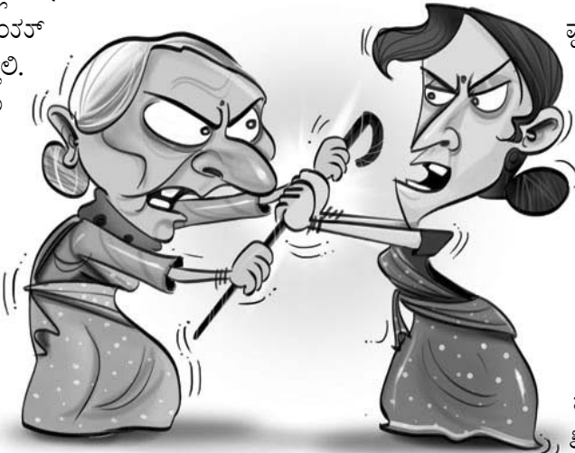
ఁక్ మట్టి కాణి

కితేం సాంగ్గేం మ్మణ్ సాంగ్” మ్మణ్ వ్మడ్ల్యా తాళ్ళాన్ బోబాబ్తా. “కాంయ్ నా మాంయ్, భాత్ కాండ్ల్యార్ తాందుళ్ జాతా మ్మణ్ సబార్ పావ్పిం సాంగిత్ గేలి మాంయ్” మ్మణ్ కార్మిణ్ వళో తాళ్ళాన్ జాప్ దితా. “కితేం మ్మణ్తాయ్? భాత్ కాండ్ల్యార్ తాందుళ్ జాతా మ్మణ్ తాణేం సాంగాజేగిఱి? హేం కోణాక్ గోత్తునా. బిండిత్ జావ్న్ తాణేం మ్మజ్యో బాడియో సాంగ్ల్యాత్. తుం తేం లిపయ్తాయ్. తుకా