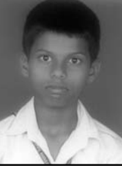
ಆಲ್ಟ್ರೇಡ್ ಸಲ್ವಾನಾ ಸೆವಾ ಧಾರ್ಮಿಕ್ ಕಾರ್ಯದರ್ಶಿ